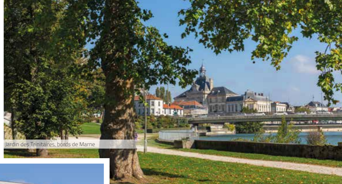
Jardin des Trinitaires, bords de Marne

« La vision de la ville change... C'est une adresse idéale pour une vie de famille chaleureuse »