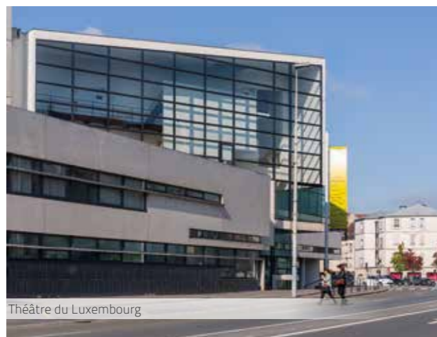
Théâtre du Luxembourg